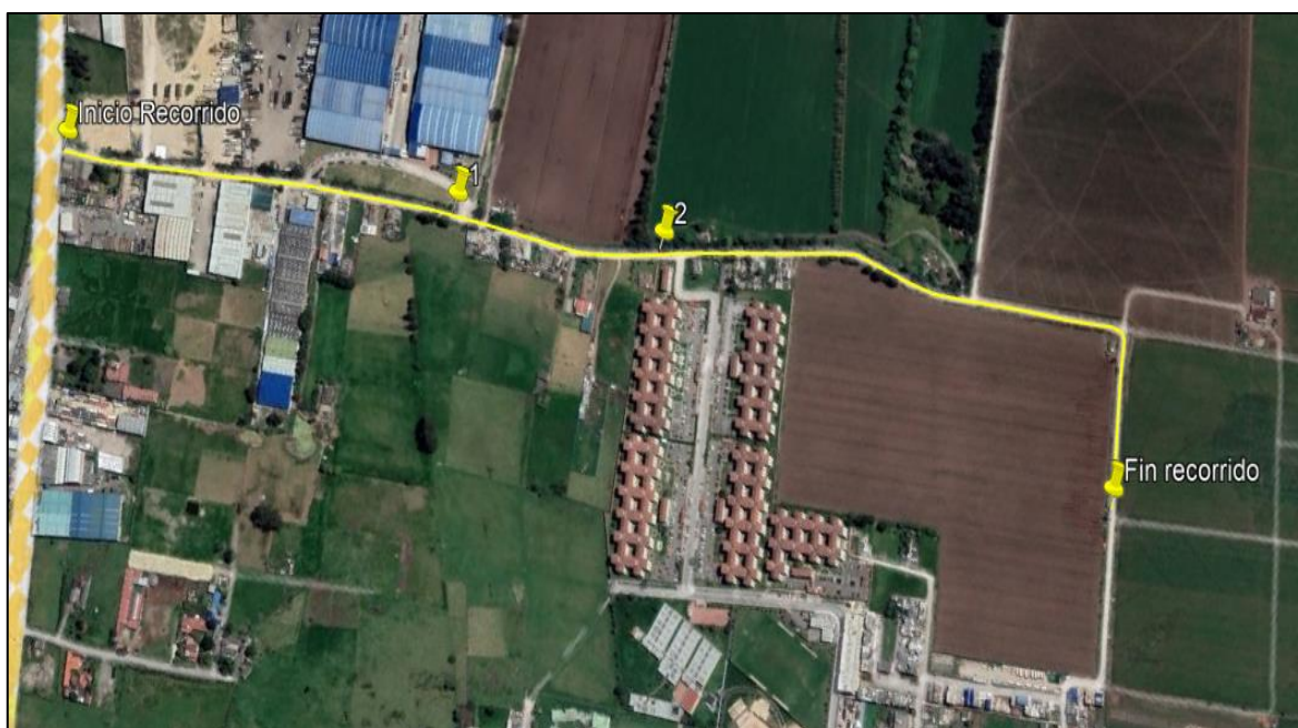
Ilustración 1. Recorrido verificación ambiental -Vereda Hato sector Casa Blanca

Se realizó recorrido de control y vigilancia de los componentes ambientales en áreas rurales del municipio de Funza, vereda Hato sector Casa Blanca el día 16 de abril de 2024, desde las Coordenadas 4°43'12.83"N - 74°11'53.14"W hasta las coordenadas 4°42'32.59"N - 74°11'38.80"W (ver ilustración 1. Ruta amarilla), con el fin de verificar las condiciones ambientales, identificar posibles afectaciones a los recursos naturales y realizar las acciones de prevención correspondientes.