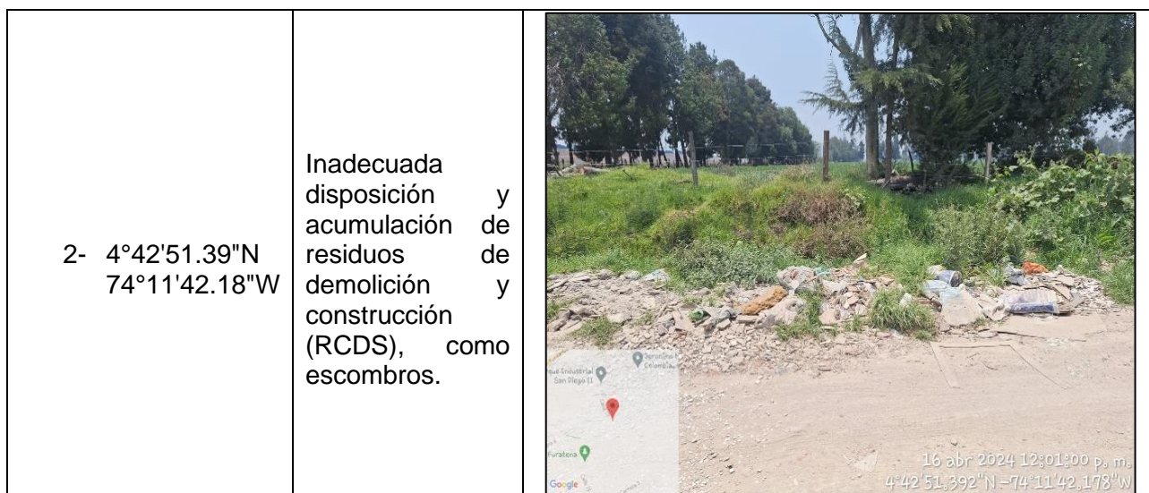
Tabla 1. Hallazgos recorrido vereda Hato sector Casa Blanca.